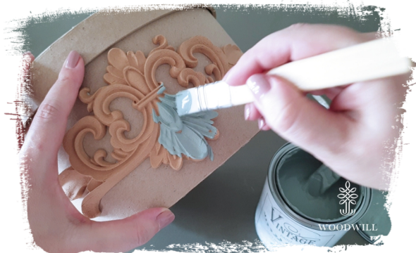
Stap 7: verf het in elke gewenste kleur