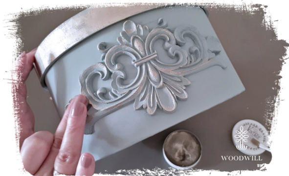
Stap 8: patineer het met decor wax als je dat wilt.