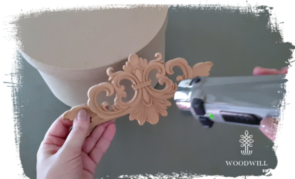
Stap 1: verwarm WOODWILL

Hoe kun je de WOODWILL ornamenten aanbrengen