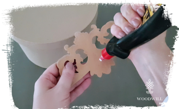
Stap 3: breng houtlijm aan