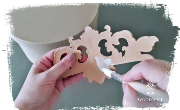
Stap 4: verspreid de lijm