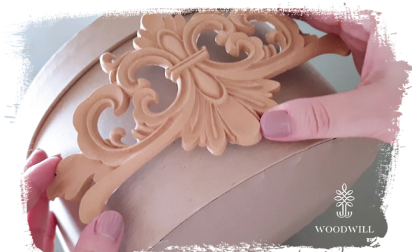
Stap 5: plaats het (opwarmen en opnieuw buigen indien nodig)