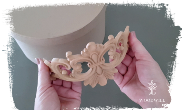
Stap 2: vorm het terwijl het heet is